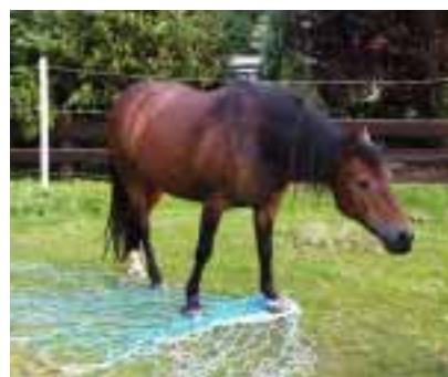
Große Ponyfüße auf kleinen Maschen von halbfer-tigem Heunetz

Meine Pferde und ich sind seit zwei Jahren sehr zufrieden mit dieser Art der Heufütterung, und ich ärgere mich nur, nicht schon früher auf die Idee gekommen zu sein!