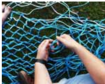
Knoten in Arbeit - das Seil ist zweifarbig, weil die zweite Rolle eine andere Farbe als die erste hatte ...

Die Materialkosten sind lächerlich gering (ca.3,- Euro pro Netz), der Arbeits- /Zeitaufwand fürs Knoten dagegen recht gross (5-7- Stunden).