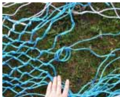
Die Maschen sollten natürlich möglichst gleichmässig geknüpft werden.