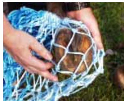
Shetty-Huf in Maschen ... wer nur Kaltblüter hat, darf auch größere Maschen knoten!